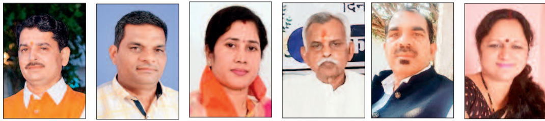
हरिभूमि न्यूज नवागढ़